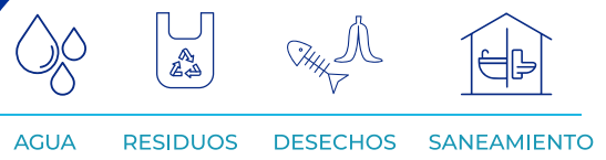
AGUA RESIDUOS DESECHOS SANEAMIENTO

La falta de agua potable, el inexistente o incorrecto manejo de los desechos sólidos y líquidos, son una de las principales causas de enfermedades, en muchos casos mortales y es preponderante en la incidencia de la desnutrición crónica. Es una de las principales